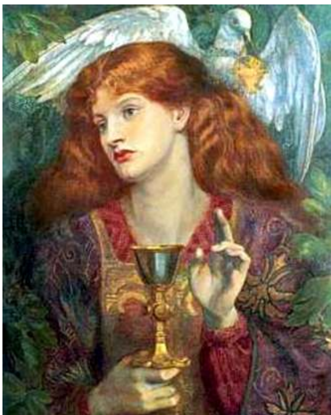
Maria Magdalena met de Heilige Graal