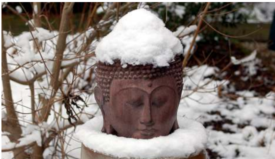
Besneeuwde Boeddha