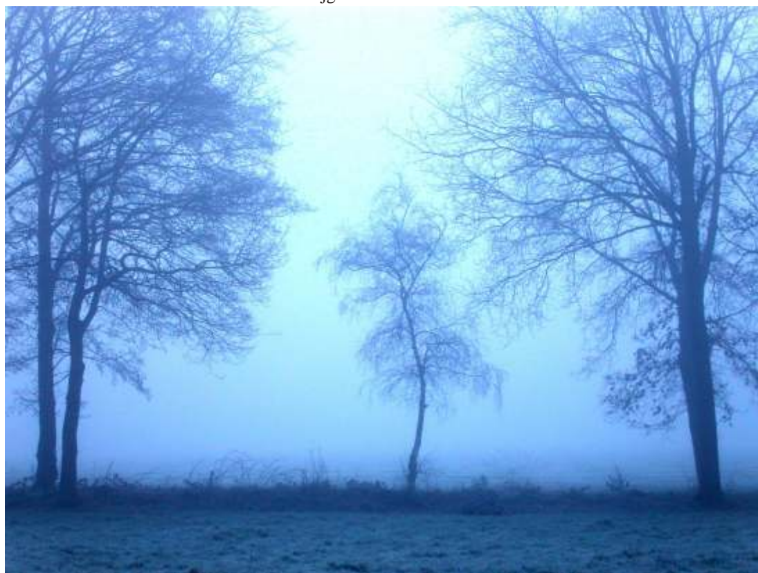
Mistige winterochtend