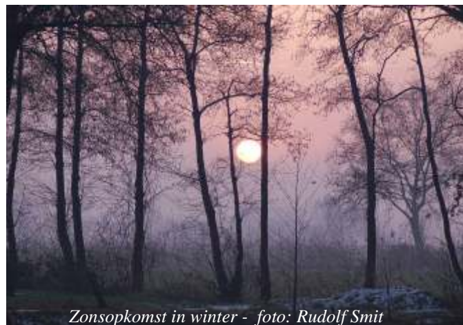
Zonsopkomst in winter