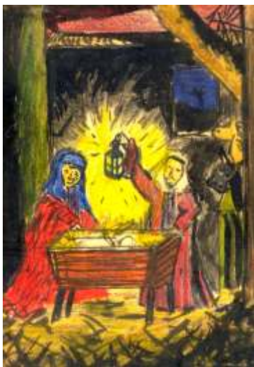
Het christuskind in het mystieke hart (getekend door een 12-jarig kind)

vaak toch beleefd als een soort herboren-zijn. Toch is dat geen reden om, op welke wijze dan ook, bijna-doodervaringen te gaan forceren. Het is niet wenselijk omdat je levens- en leerproces dan ook voortijdig kan aflopen, met een levensechte fysieke dood die anderen verdriet brengt en waarna je zelf in zekere zin weer helemaal van voren af aan moet beginnen; en het is niet nodig omdat het gewoon ook heel anders kan, dat sterven en opnieuw geboren worden. Het gaat immers niet om letterlijk, fysiek (bijna)