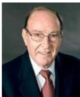
Edgar Mitchell op latere leeftijd