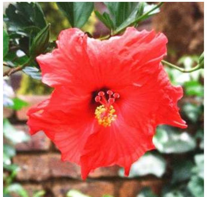
Hibiscus in Zuidafrika