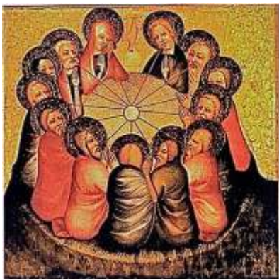
Autelwestphalien (van Westfaals altaar, ca 1370/1380) De uiterlijke zon hongert naar de innerlijke. Jacob Boehme, De Signatura Rerum, 1622)

Het Pesach feest is daarmee een typisch feest voor de Joodse gemeenschap, waaraan christenen niet zo gemakkelijk kunnen deelnemen. En de Joodse sedermaaltijd heeft, ofschoon de christelijke traditie het anders probeert te zien, nauwelijks iets te maken met het christelijke 'Avondmaal' of de 'Eucharistie' zoals wij die momenteel kennen. Waarom niet?