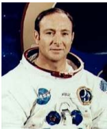
Edgar Mitchell vlak voor zijn reis naar de maan in 1971

Een van zijn beroemde voorgangers, Edgar Mitchell, deed dat wel. Hij maakte deel uit van de Apollo 14-missie naar de maan en wandelde in februari 1971 ruim negen uur, zwaar ingepakt, op onze ijskoude satelliet. Na zijn terugkeer op de aarde ontving Mitchell meerdere eredoctoraten en hij werd zelfs voorgedragen voor de Nobelprijs van de vrede. De zesde bezoeker aan de maan onderging een diepgaande transformatie en daar maakte hij nooit een geheim van. "Iedereen die een ruimtereis heeft gemaakt en daarbij terugkeek naar deze schitterende, blauw-witte haven van aardse leven, heeft zich vol ontzag afgevraagd wat eigenlijk de implicaties zijn van het bestaan van levende wezens op een eenzame planeet, rondcirkelend in het zwaartekrachtveld van een doorsnee-ster, waarvan er miljarden in ons sterrenstelsel bestaan. Hoeveel andere planeten met leven zijn er nog meer rond deze sterren?"