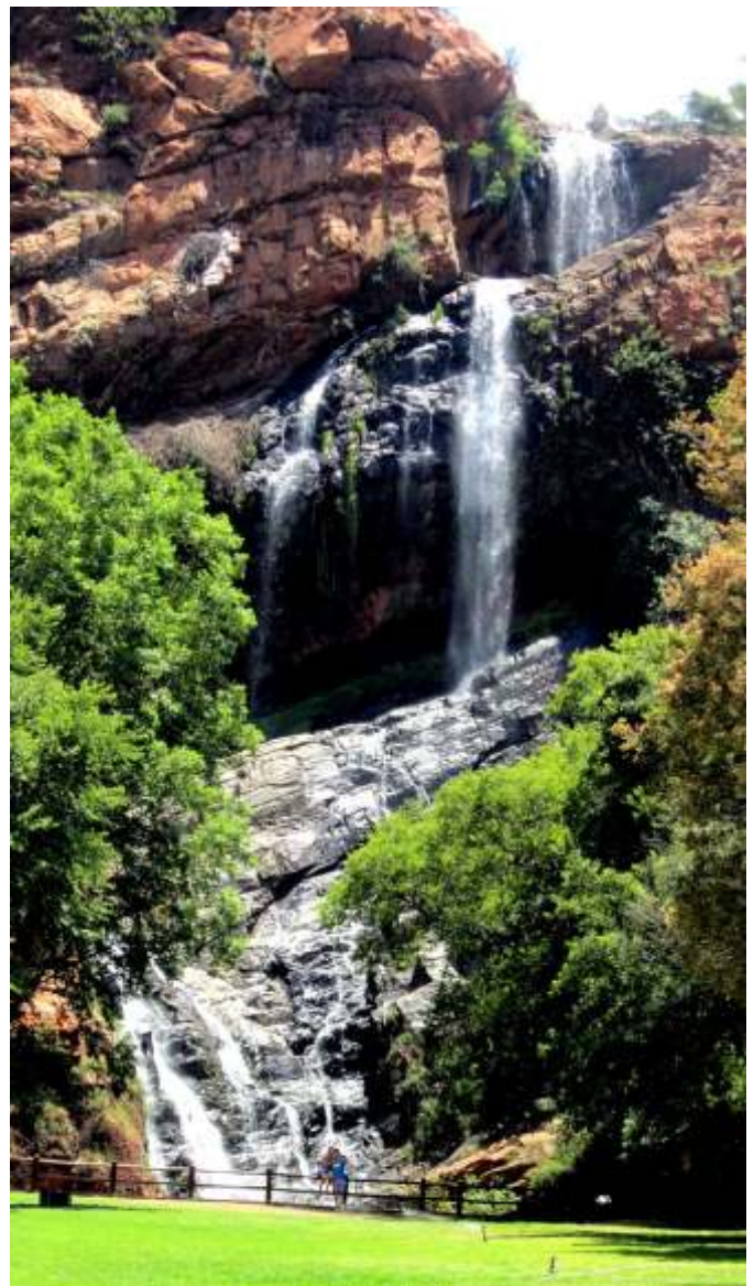
Onderstaande foto van een waterval in Zuidafrika werd genomen door Jannie van Alphen-Hofkamp