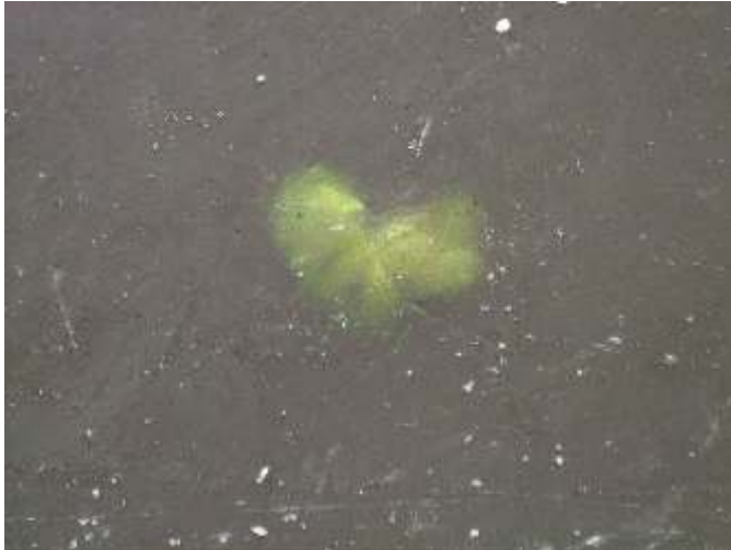
Mijn eerste winter in Steenwijkerland. Het was tien jaar geleden dat er geschaatst kon worden op natuurijs. Maar ondanks die kou, was er leven onder een dikke laag ijs.

In de VKK kg. Raalte ontmoette ik een leuke man, we zijn na een half jaar in een leuk huis in Steenwijk samen gaan wonen. Daar voel ik me thuis en kan ik mezelf zijn. Nu twijfel ik niet meer over mijn relatie. Mijn vriend is net zo zorgzaam en lief als mijn moeder! Het was Liefde op het eerste gezicht. Er waren geen vragen meer in mij over macht en machthebbers.