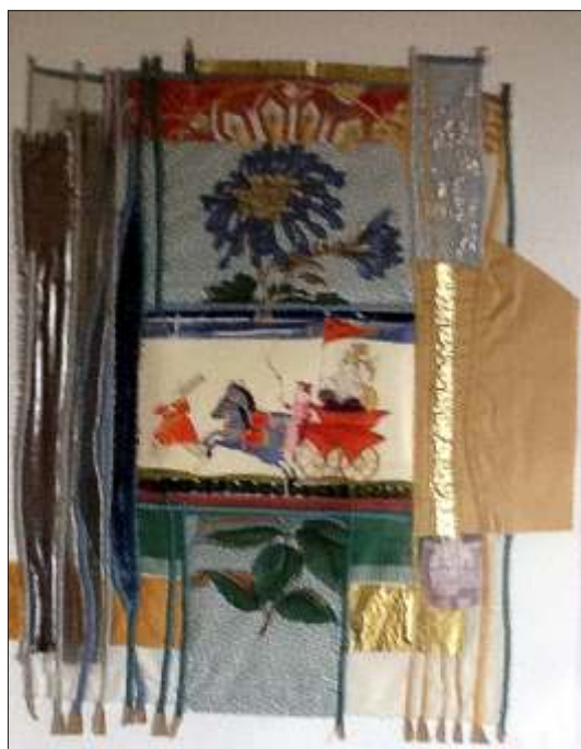
Een textielcollage geïnspireerd door de ‘Bhagavad Gita’, door Reinier Pepping

Het is de klank die blijft natrillen. De klank van het leven die ons tijdens iedere treinreis vergezelt, ook de mooie en minder mooie klanken en vaak zijn het die laatste klanken die tijdens het vervolg van die reis boven komen. Tijdens momenten van reflectie en bezinning met op de achtergrond de cadans van de rijdende