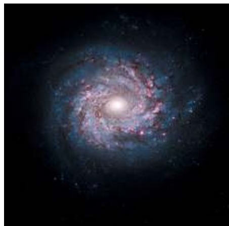
Een spiraalgalaxy ("melkwegstelsel"). Opname door de Hubble telescoop van de nevel NGC 3982

Een geheel ander onderwerp is de vraag of de ziel van Maria evolueert. Maria staat voor de groeikracht van de scheppingen in het hele universum, dus ook die in onze wereld. Door evolutie verandert de vorm door middel van transformatie. In het Christelijke verhaal wordt Maria gezien als degene die vorm kan geven aan het geestelijke Licht dat met de zonnwende in de winter weer terugkomt uit het zuiden of wel de geestelijke wereld. Ook dit begrip is niet alleen in het Christendom bekend maar ook in andere culturen. In Bijbelse vertalingen van oude levensverhalen werd het symbool 'Maria', de vorm van Zeeën, gezien in Mare, het woord voor Zee. Dit past goed bij andere scheppingsverhalen waar de wijsheid, om nieuw leven te vormen, uit de zee of oceaan komt. Bijvoorbeeld de Vis-sengod Oannes kwam in Mesopotamië ook uit de zee om de mensen te leren op welke wijze zij de aarde zouden moeten besturen. De Vis komt astrologisch weer voor als het tijdperk aanbreekt van wat wij de Christelijke jaartelling noemen.