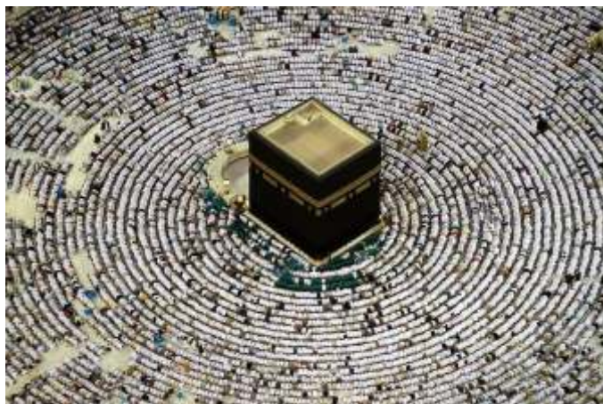
Ka'ab in Mekka